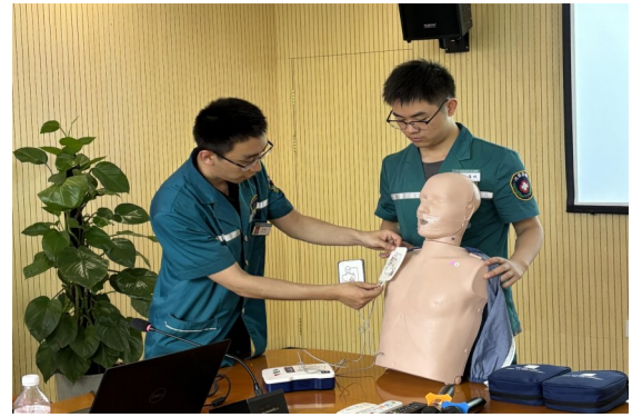
7月24日,五公司中原区赵坡棚户区改造项目联合河南省直第三人民医院开展“全民急救技能培训”活动,进一步增强了员工自救互救意识,补强现场急救处置技能短板。