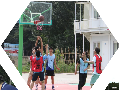
篮球比赛