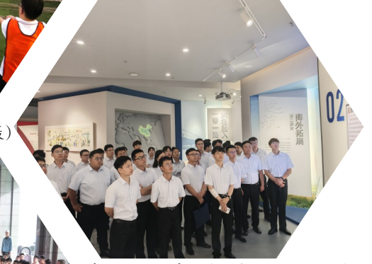
参观初心使命馆