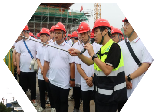
到工地学习参观