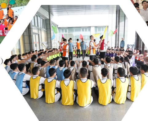
趣味活动