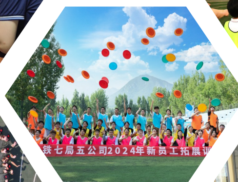
拓展训练