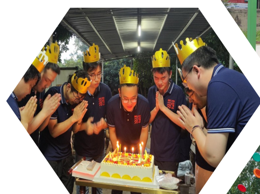
集体过生日

编者按 7月,来自全国多所高校的700余名同学正式成为了中铁七局大家庭的一员。中铁七局各单位精心组织、多方联动积极开展入职培训、红色基地教育、户外拓展等各项活动。此次培训不仅是一场知识与技能的盛宴,更是新员工职业生涯启航的坚实基础,愿大家不忘初心、牢记使命、砥砺前行,在各自的岗位上发光发热,为中铁七局高质量发展贡献新的力量。