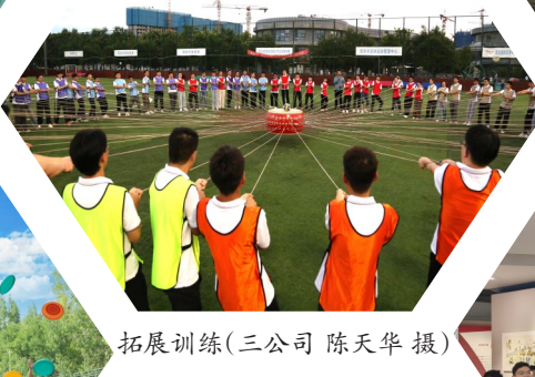
拓展训练