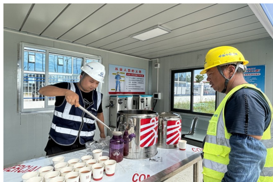
7月5日至7日,中铁七局无锡中欧产业园项目部深入施工现场开展夏日送清凉活动,并在高温季节调整作息时间,增加休息时间,提供防暑降温用品等,真正关心关爱员工。