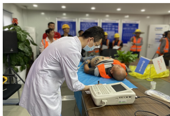
7月2日,中铁七局航空港高铁配套项目部根据施工安排,将体检中心“搬”到了施工现场,为项目400余名农民工安排了一次“足不出户”的健康体检,让员工们进一步了解自己的健康状况,增强健康保护意识,有效预防疾病发生。