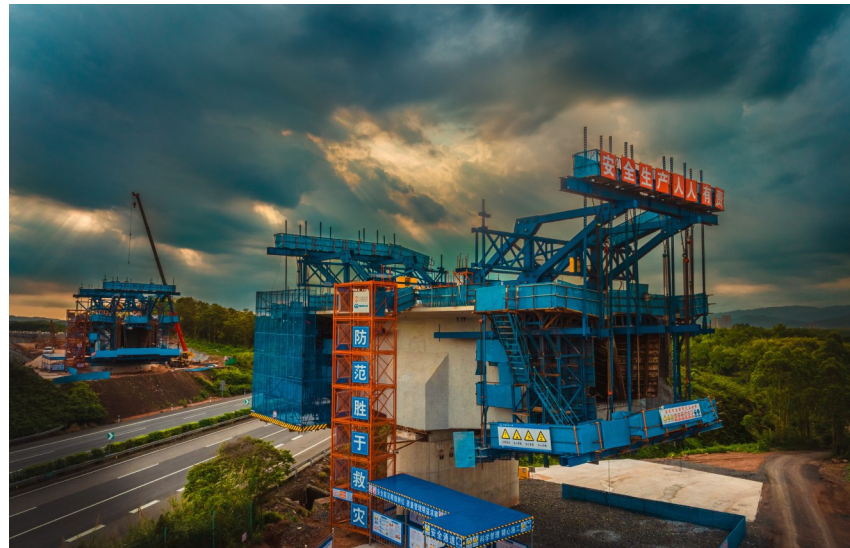
立夏 广东省铁路工程指挥部 翟刚摄