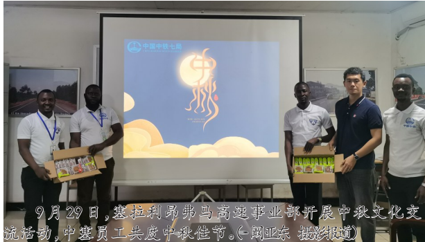
9月29日,塞拉利昂弗马高逸事业部开展中秋文化交流活动,中塞员工共度中秋佳节。