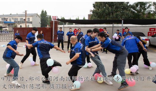
9月29日,郑州公司河南国际物流枢纽铁路专用线项目部开展文体活动