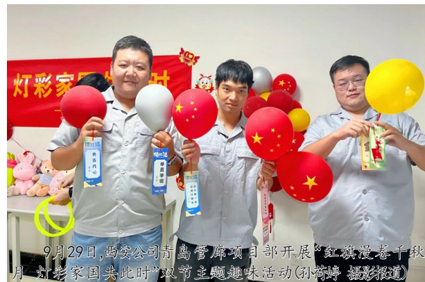
9月29日,西安公司青岛管廊项目部开展“红旗漫卷千秋月,灯笼家国共此时”双节主题趣味活动