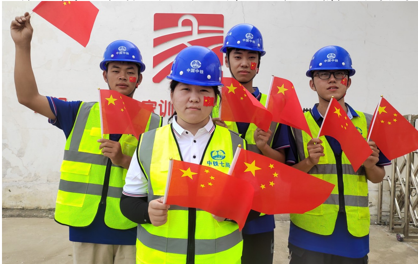
国庆前夕,二公司南邓高速项目部组织我和国旗合影活动